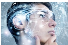
MAN WITH A MISSION